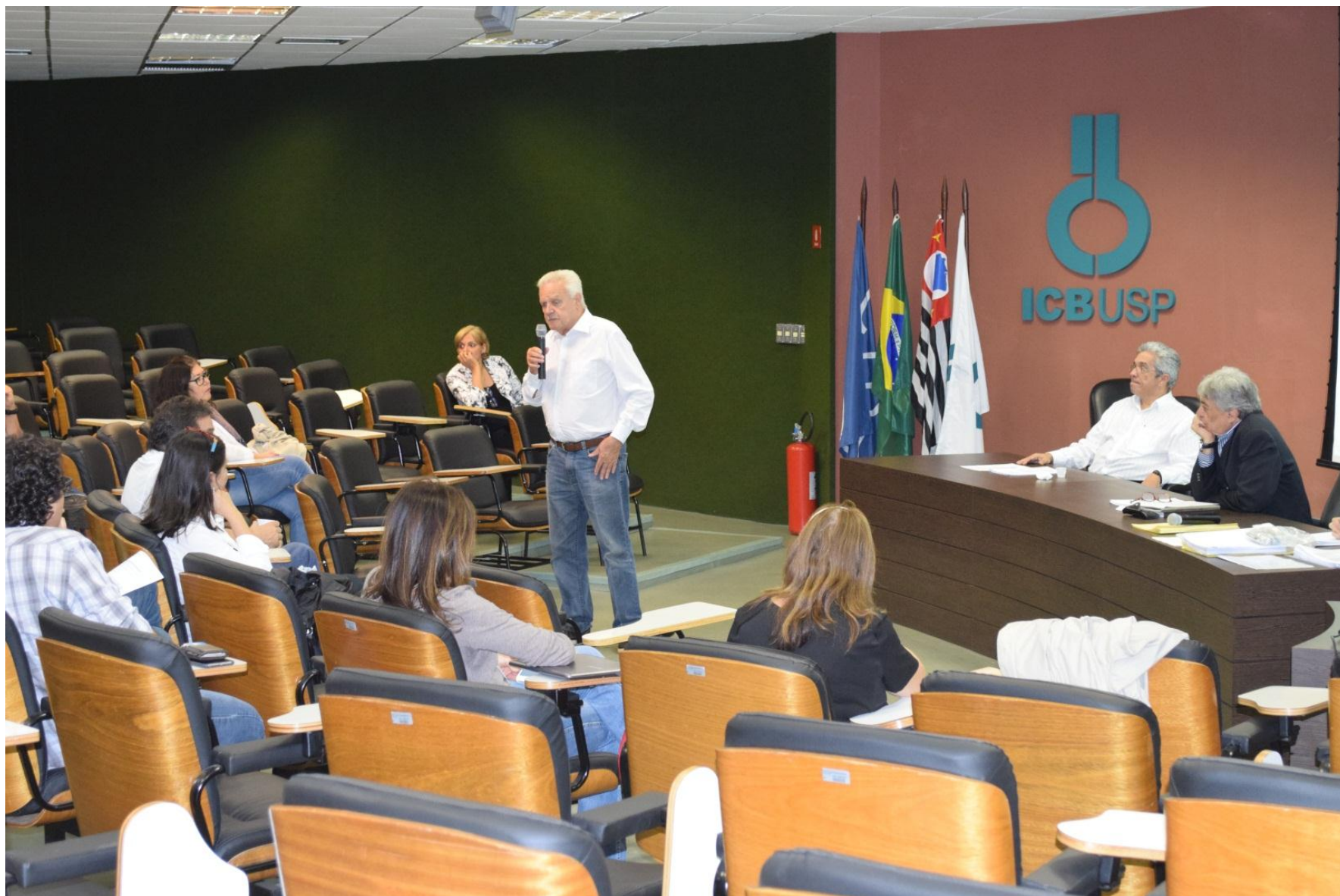
Cerimônia de Lançamento – Obra restaurada – Congregação | 07/12/2015