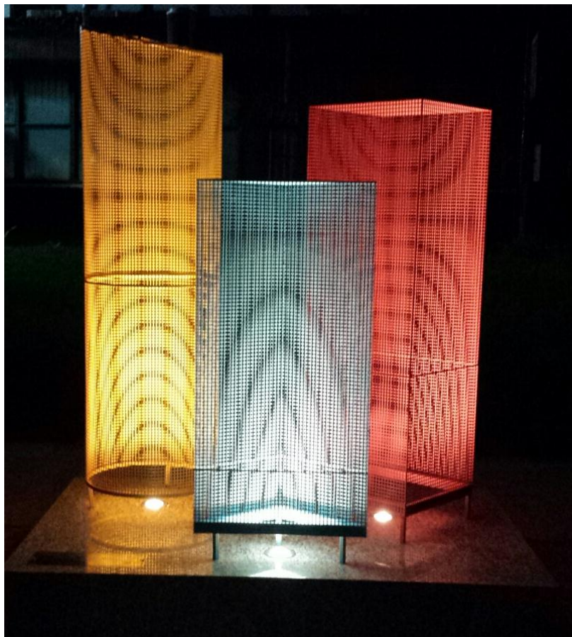
Escultura: iluminada à noite, entre o ICBIV e ICB I

A Comissão de Cultura e Extensão Universitária do Instituto de Ciências Biomédicas da Universidade de São Paulo apresenta com membros da Congregação ICB (07.12.2015), o restauro da obra de arte em homenagem ao Professor Samuel Barnstein Pessôa: