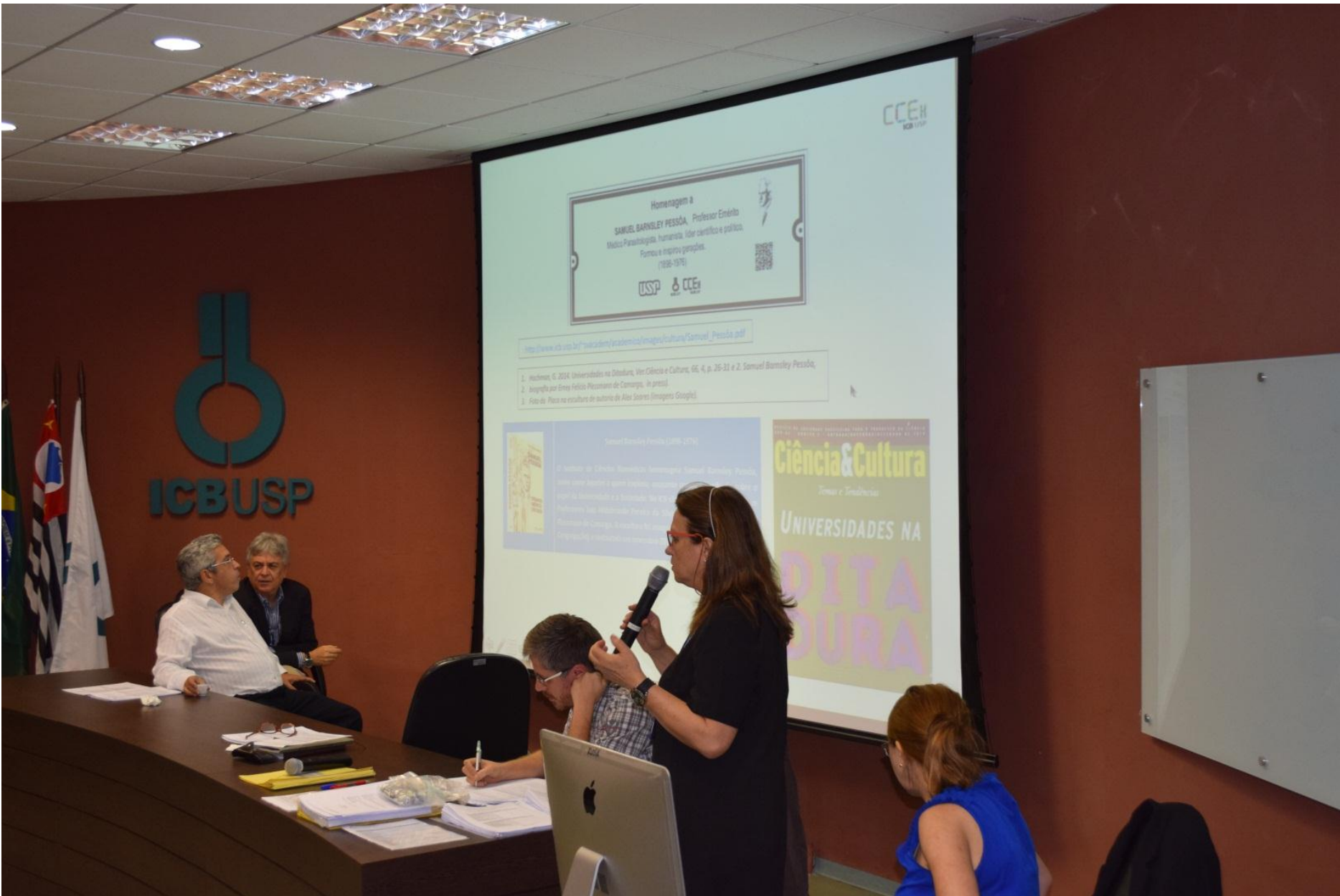
Cerimônia de Lançamento – Obra restaurada – Congregação | 07/12/2015